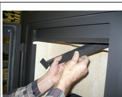
Metalowy wspornik szamotu