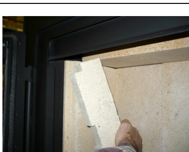
Boczna mała bryła szamotowa