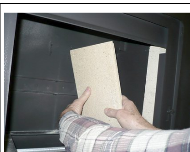
Boczna duża bryła szamotowa