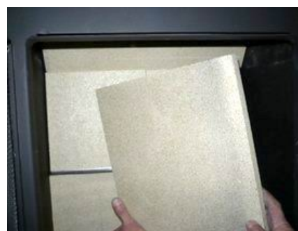
Bryła boczna prawa