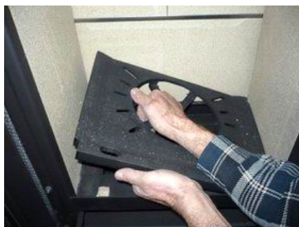
Wyjęcie ramy rusztu