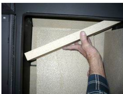
Bryła przegrody dolna (deflektor dolny)