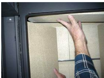
Bryła boczna lewa